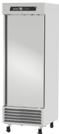
ARF 23 H HC

220V. - I - 50Hz. o 220V. - I - 60Hz. (con costo adicional). Consultar al fabricante si es factible su fabricación, el código correspondiente, la potencia y el amperaje.