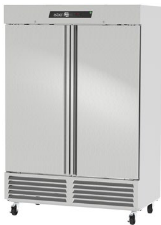
ARF 49 H HC