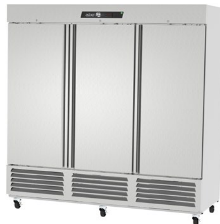
ARF 72 H HC