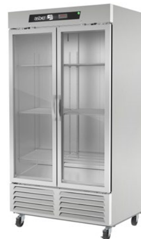
ARF 37 G HC