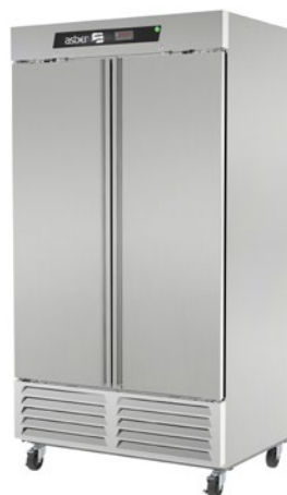
ARF 37 HC