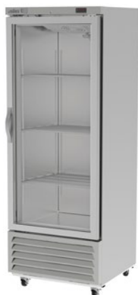
ARF 17 G H HC