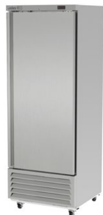
ARF 17 H HC

220V. - I - 50Hz. o 220V. - I - 60Hz. (con costo adicional). Consultar al fabricante si es factible su fabricación, el código correspondiente, la potencia y el amperaje.